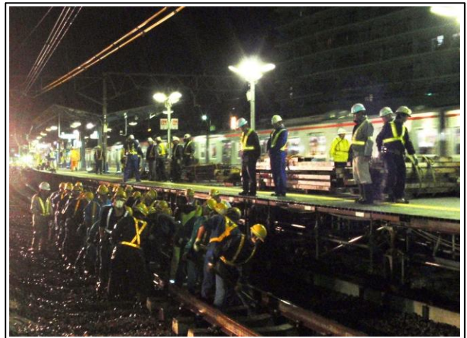
写真-② 人力によるレールの振込み作業 （星川駅1番線より海老名方を望む）