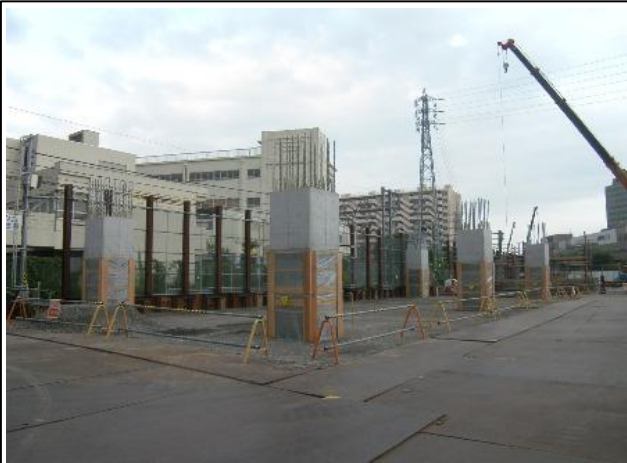
写真-④ 高架橋の躯体構築状況 (天王町2号～3号踏切間南側から横浜方を望む)

現在、天王町2号～3号踏切の南側に設置する高架橋の柱の構築準備を進めています。(写真-④、図-②参照) 今年度末までに同区間においては約30本の柱が立ち上がる予定です。また、星川駅のホーム中央部においては、1～2番線をまたぐ形で高架橋の鉄骨の架設を進めていきます。(図-①、②参照)