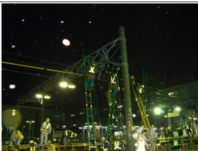
写真-③ 架線切替え調整作業 （星川駅1番線より北側を望む）

当日の夜は沿線にお住まいの方々にご迷惑をおかけしましたが、無事作業を完了することができました。あらためて深く感謝いたします。この切替えにより、既設の線路が全て北側に移設されたこととなります。