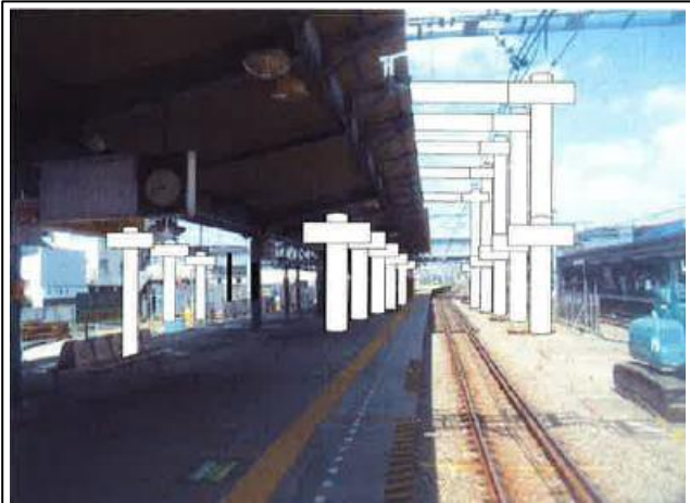
図-① 星川駅1・2番線ホームイメージ図 (星川駅下りホーム中央部から海老名方を望む)