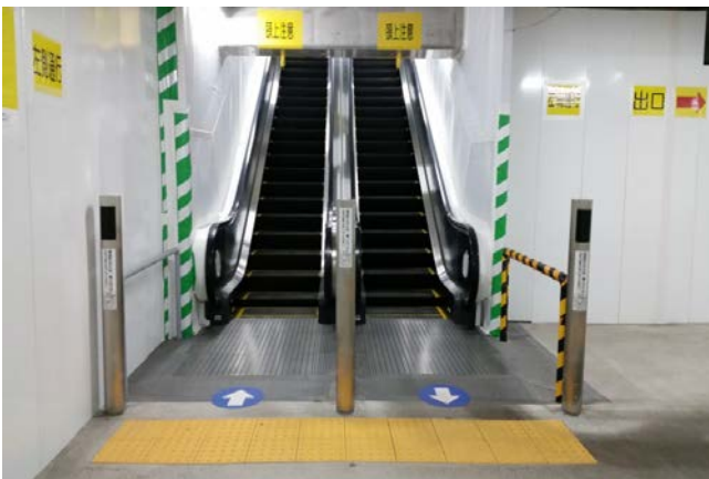
写真⑤ エスカレーターの設置状況