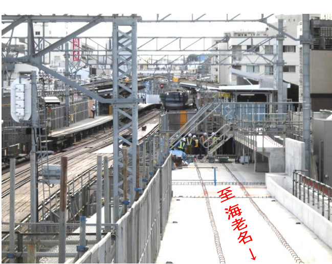
写真① 天王町駅の工事状況