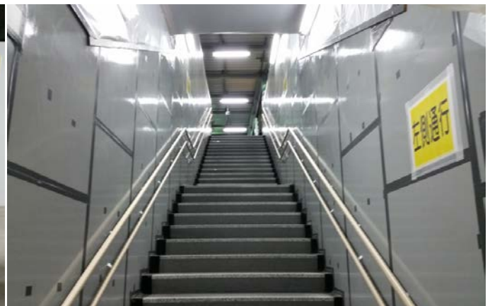
写真⑥ 階段の設置状況