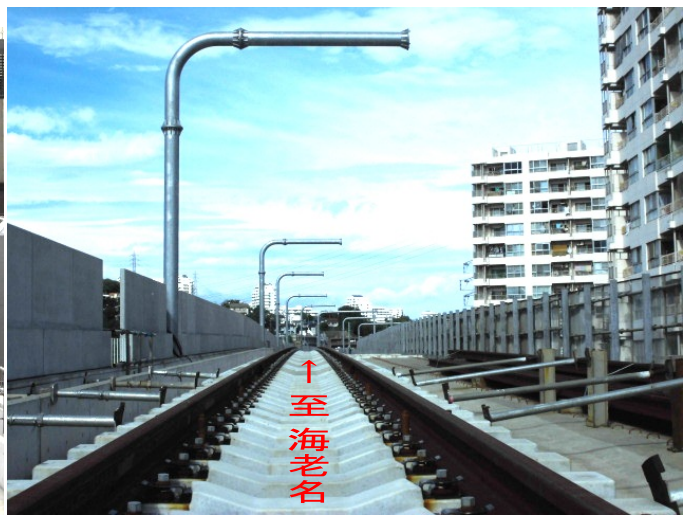
写真② レールと電柱の設置状況（天王町1号踏切付近）