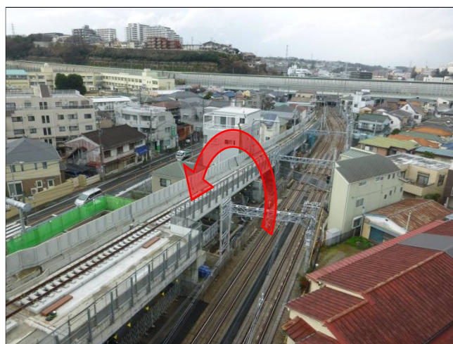
写真2。現在の下り線から高架橋上への切替（星川4号踏切付近）