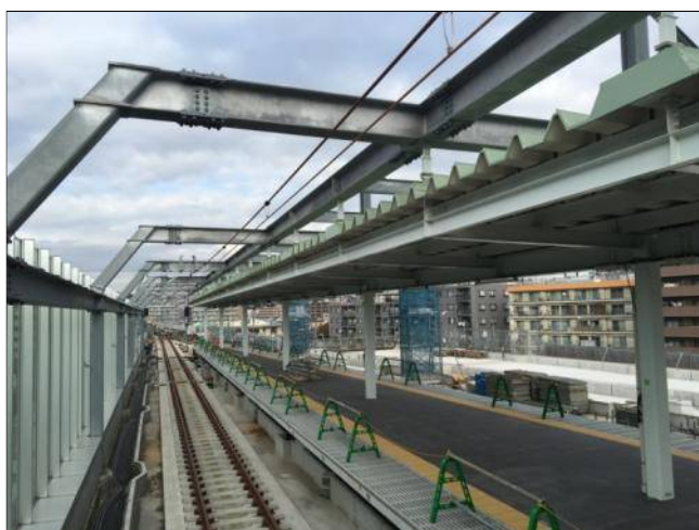
写真1。星川駅の新しい下りホーム