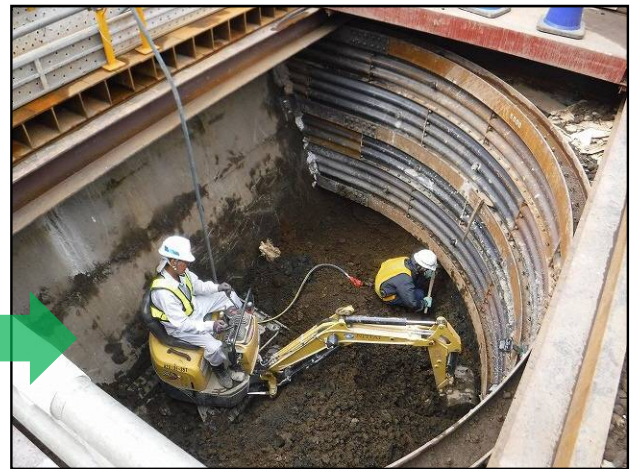
写真 2. 上り線の掘削状況②