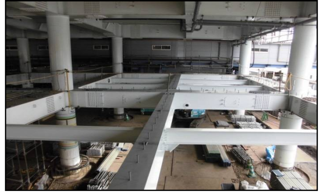
写真6.コンコース階の工事状況