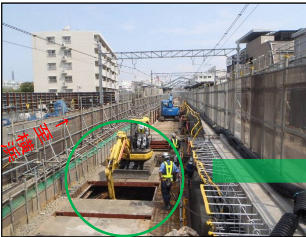
写真 1. 上り線の掘削状況①

天王町駅の二俣川側では、上り線の高架橋の基礎となる部分の掘削工事を行っています。