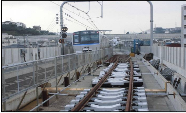
写真5.上り線のレール敷設状況

高架上ではレールの敷設を、高架下では駅のコンコース階となる部分の構築を進めています。