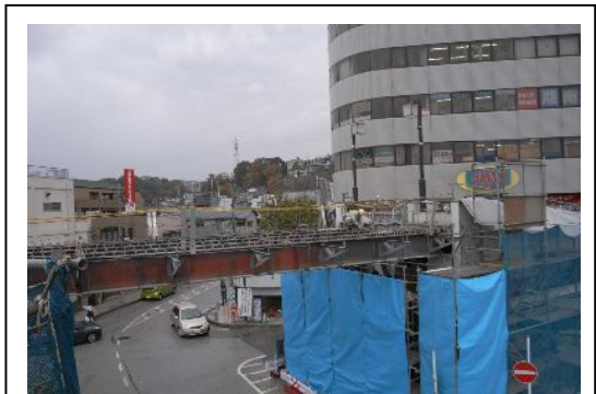
写真-⑤ 撤去作業の進む星川SFビル連絡通路 (平成19年12月撮影)

3月末からご利用いただく仮駅舎では、ホームとコンコース（改札内通路）をつなぐエレベーターがご利用いただけることになり、既にご利用いただいている北口