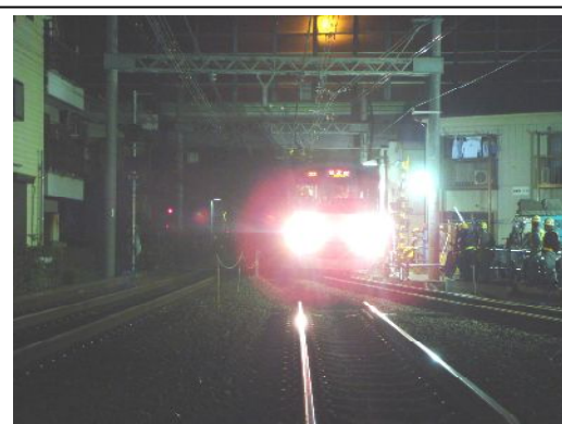
写真③ 切替え箇所を走行する試運転列車 ：星川6号踏切付近（平成19年11月撮影）