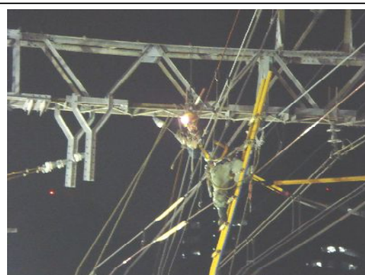
写真② 軌道の切替えに伴う架線調整作業 （平成19年11月撮影）