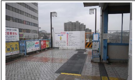
写真-④ 閉鎖した星川SFビル連絡通路 (平成19年12月撮影)

エレベーター、12月3日からご利用いただいている星川SFビル・ペデストリアンデッキにつながる駅南口エレベーターにより、駅のバリアフリー化が図られます。