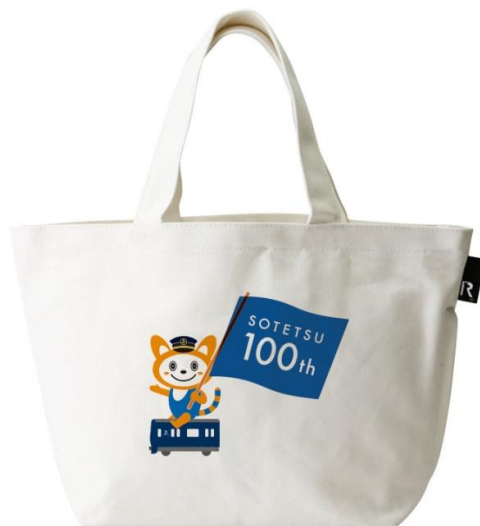
「そうにゃんルートート」（イメージ）