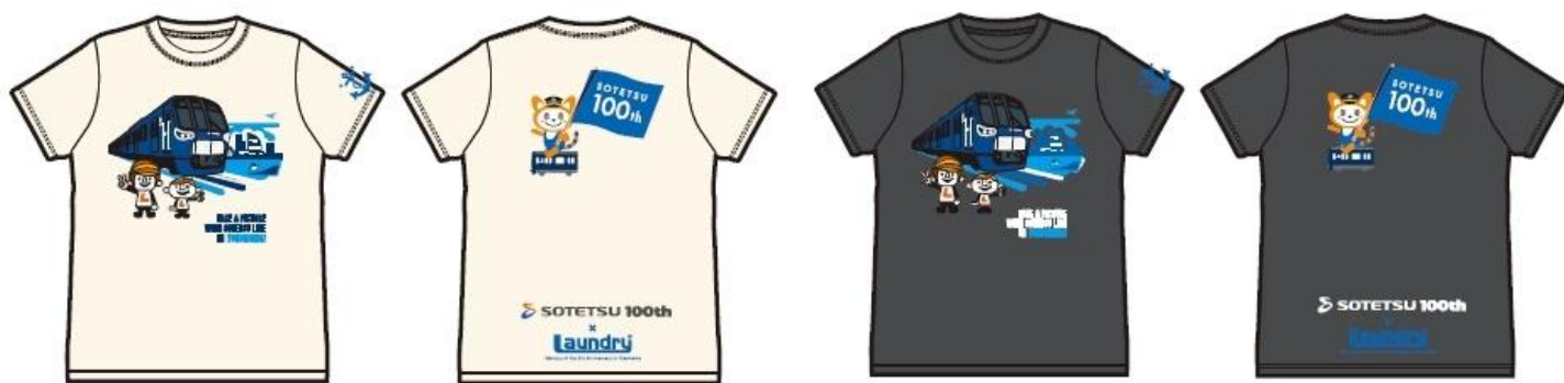
電車（20000系）とそうにゃんがデザインされたTシャツ（イメージ）