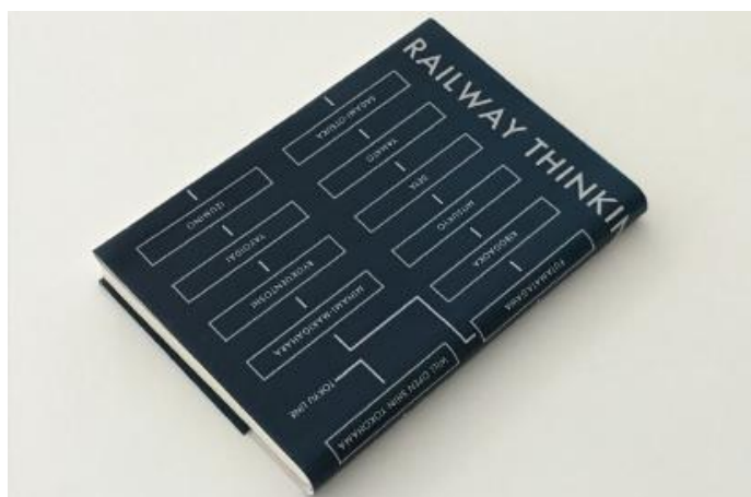
相鉄線の路線図をモチーフにした文庫カバー（イメージ）