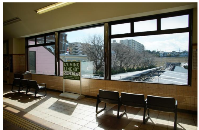
桜をご覧いただけるオリジナルベンチ