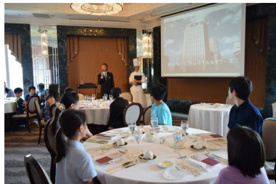
昨年開催時の様子