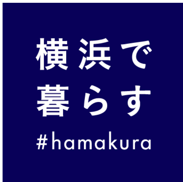
「横浜で暮らす #hamakura」アイコン