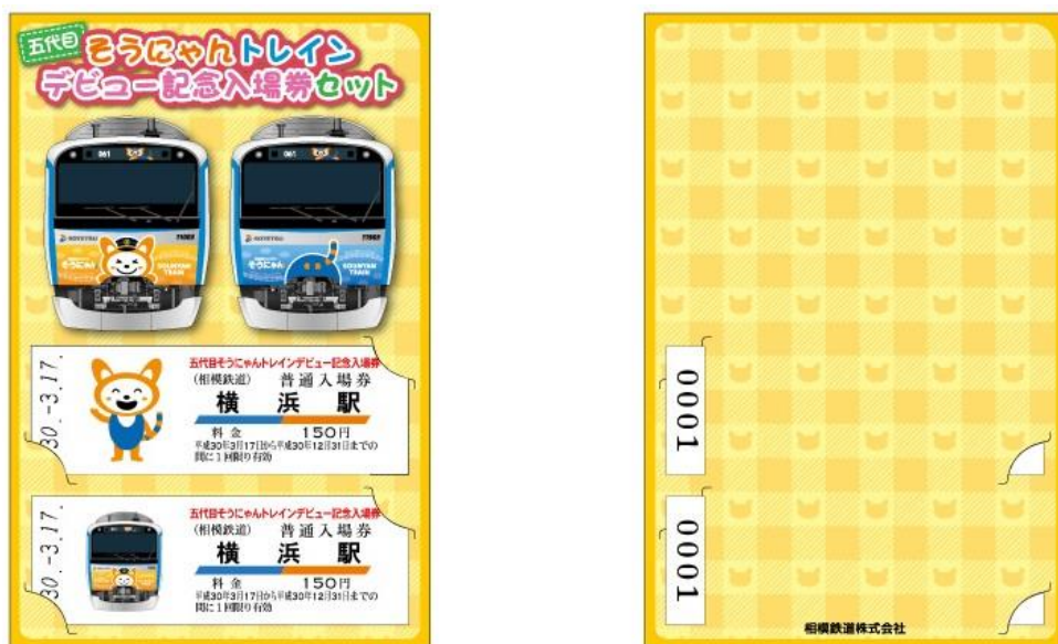
「五代目そうにゃんトレインデビュー記念入場券セット」（イメージ）