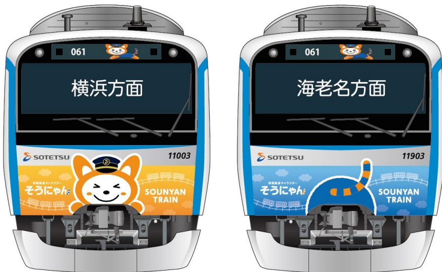
「五代目そうにゃんトレイン」（イメージ）