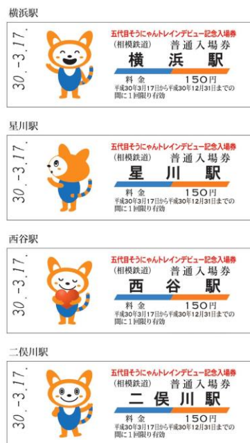
「D型硬券普通入場券」（イメージ）