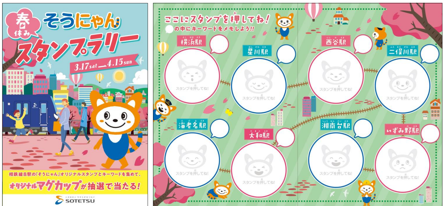
「春休み そうにゃんスタンプラリー」のスタンプ帳（イメージ）