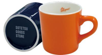
オリジナルマグカップ(イメージ)