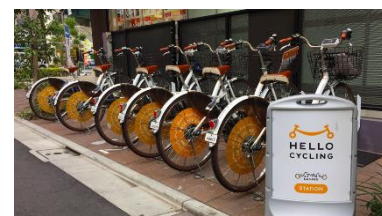
シェアサイクル（イメージ）

環境に優しい自転車を設置。最終バスの後はシェアサイクルで帰宅して翌朝は駅まで乗ることができます。また、朝は車で送迎、帰りは迎えがない場合に自転車での帰宅が可能です。