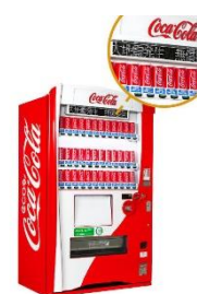
自動販売機（イメージ）

災害時には、自動販売機の飲料水を無償提供します。自動販売機のメッセージボードや無料公衆無線LAN（光ステーション）を使い、緊急情報の収集が可能です。