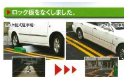
ロックレス（イメージ）

ロック板の乗り越えがなくなり、多くのお客さまが駐車しやすく、場内での接触事故などを減らすことにつながります。また、車高の低い車の底部とロック板が接触する心配もなくなり、安心して駐車できます。