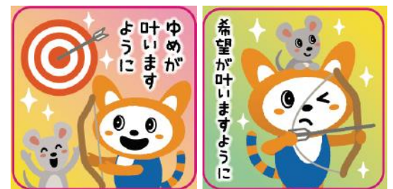
「オリジナル絵馬」と「ピンズ」 (イメージ)