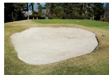
甲府国際カントリークラブ 16番ホールのバンカー

商品名 バンカーお守り 概要 甲府国際カントリークラブ(山梨県笛吹市)の16番ショートホールのバンカーの砂を小瓶に詰めたものです。このバンカーは形が五角形(合格)をしており、コースの特性上、ボールがバンカーに入りやすく、嫌でも「入ってしまう」と言われていることから、志望校に入学したい受験生や就職活動中の方々のお守りとして、大変ご好評をいただいているものです。 販売期間 2019年12月12日(木)から2020年3月31日(火) 販売場所 相鉄線駅売店15店舗 販売価格 390円(税込み) / 桜咲く〔39(さく)〕にかけて 販売数 限定2,000個 お問い合わせ 相鉄ステーションリテール(株) 駅売店担当 電話045-319-2329 (10:00～17:00、土休日・12月30日～1月3日除く)