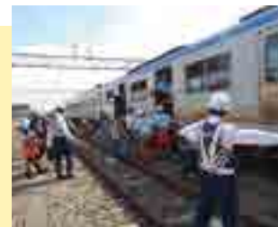
▲異常時訓練の様子

A 相鉄線では、気象庁が発信する「緊急地震速報」を受信し、沿線のどこか1カ所でも震度4以上の揺れが予想される場合、列車無線を通じて全列車を停止させ、被害の軽減を図る「早期地震通報システム」を導入しています。さらに、沿線6カ所に地震計を設置し、点検区間を細分化することで、運転再開までの時間短縮に努めています。