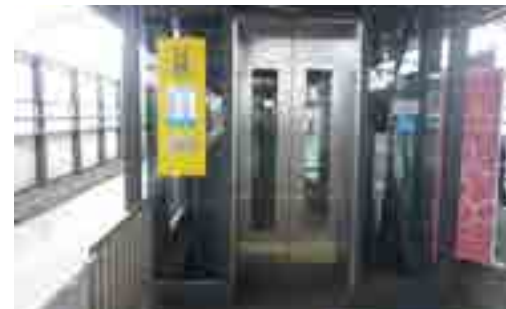
▲相鉄線駅舎のエレベーター

A 駅舎のエレベーターは、「早期地震通報システム」の情報を受信すると自動的に最寄り階に停止してドアが開き、お客様の閉じ込め防止を図っています。