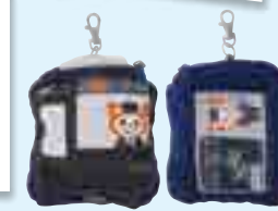
そうにゃんバスケース2 ※イメージです。

5歳の息子は電車が大好きです。相鉄線の詳しい情報が分かる雑学クイズなどが載っていると面白いなと思います！ 40代/女性