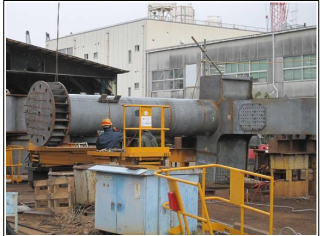
写真-④ 星川駅部高架橋柱仮組立状況