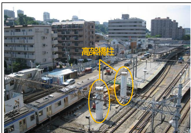
写真-① 天王町3号踏切の高架橋柱の状況 （天王町3号踏切から海老名方を望む）

現在、星川駅下りホームの横浜方において、天王町3号踏切上部をまたぐ高架橋の工事をしています。5月21日（金）と6月7日（月）の夜間に鋼製の柱を建てる工事、及び梁の一部を架ける工事を行いました（写真-①、②参照）。今後は、星川駅の1番線切替え後に南側の柱の施工に入る予定です。