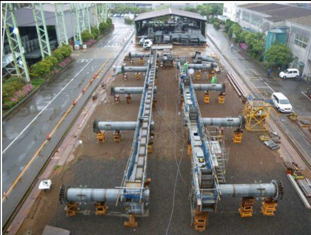
写真-③ 星川駅部高架橋仮組立状況

現在、工場にて星川駅部の高架橋の製作が進んでいます（写真-③、④参照）。工場では各パーツに加工された鋼材を溶接やボルトで仮に組立て、実際に現場で組み立てられるかを事前に確認します。仮組立の確認を行った後、現場に搬入され架設されます。