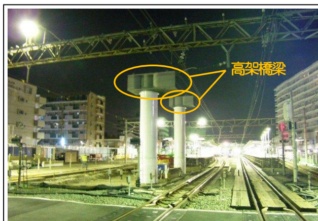
写真-② 天王町3号踏切の高架橋梁の架設状況 （天王町3号踏切から海老名方を望む）