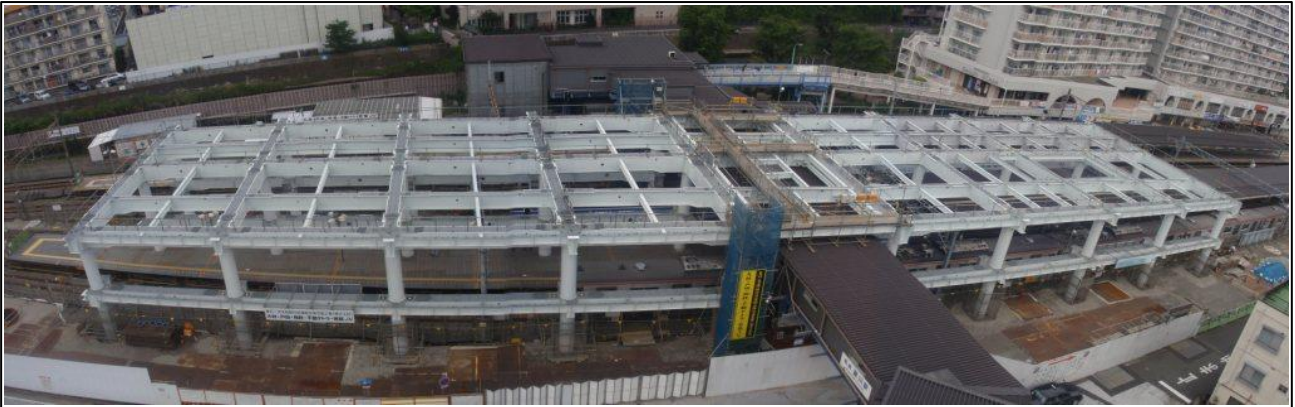
写真-⑤ 星川駅鉄骨架設状況（南側から北側を望む）