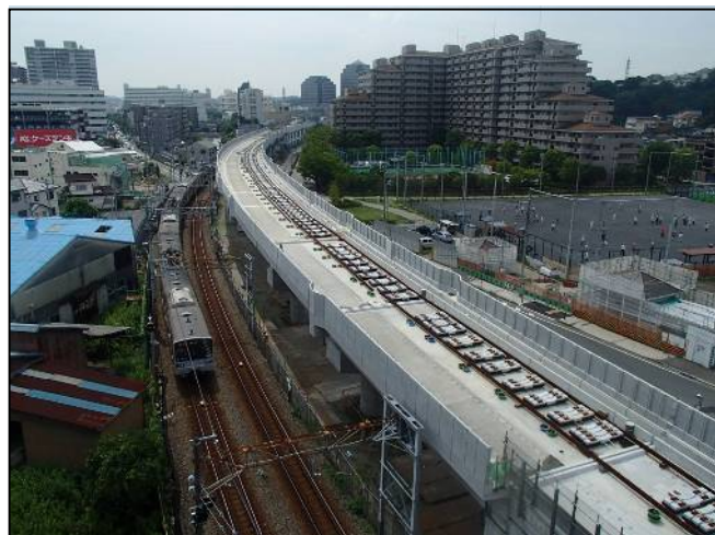
写真② 星川3号踏切から星川駅方面を望む