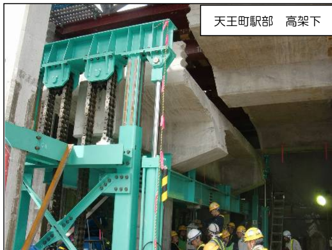
写真④ 天王町駅の既設構造物を撤去しています