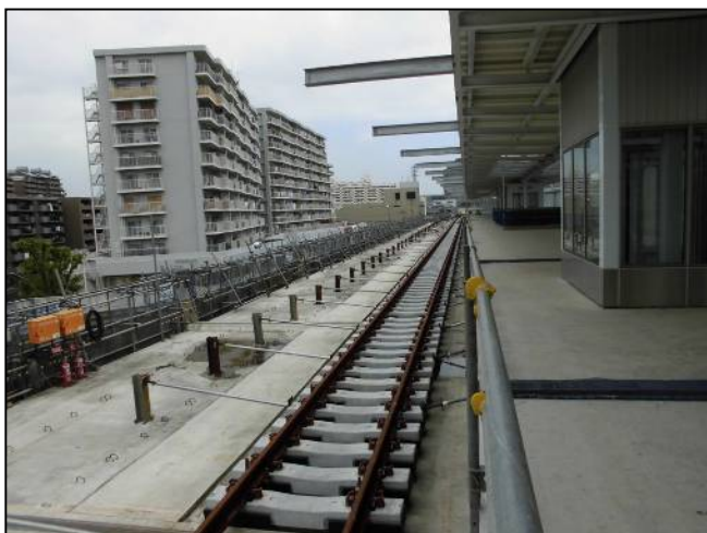
写真① 星川駅下り線ホームから天王町駅方面を望む