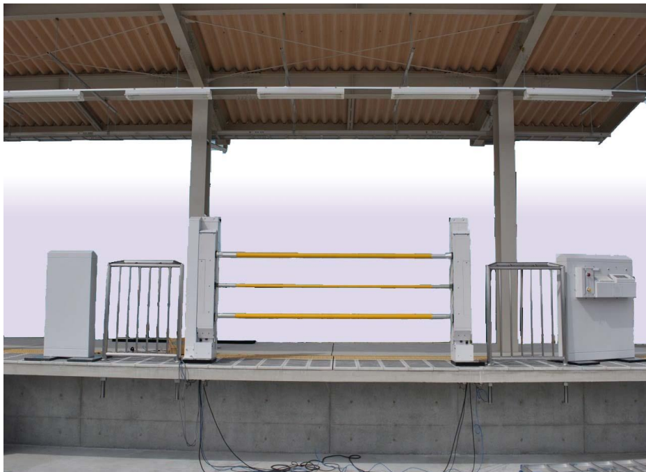
弥生台駅に設置される昇降式ホームドア（イメージ）

なお、この実証試験は国土交通省鉄道局の鉄道技術開発費補助金の支援を受けて行われるものです。概要は別紙のとおりです。