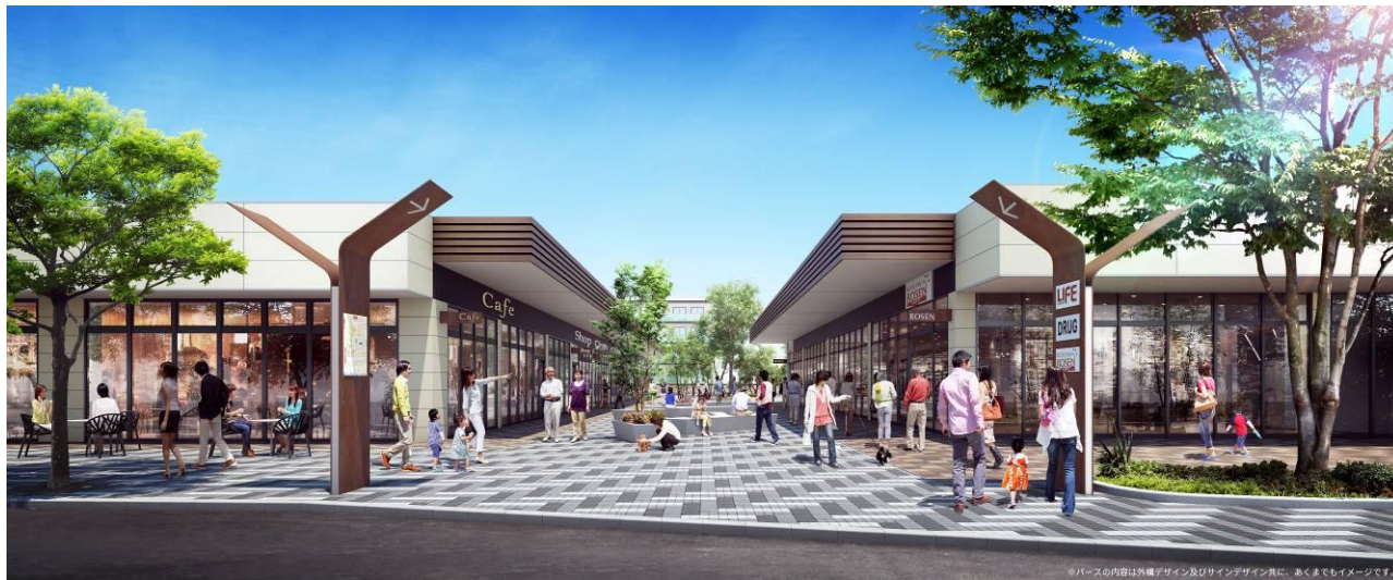
全面開業後のイメージ