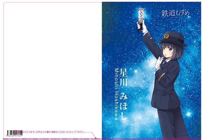
クリアファイル（イメージ）