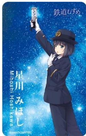
合図灯が光るP I I C A®（イメージ）

キャンペーン期間中【2018年7月1日（日）から14日（土）】までに「そうてつグッズストア」で記念グッズを1点ご購入のお客さまに、ご購入特典として「星川みほし オリジナルポストカード」1枚をプレゼントします。