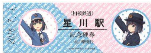
星川駅「記念券」(イメージ)