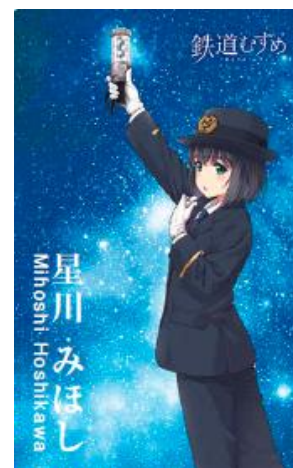
オリジナルポストカード（イメージ）

お問い合わせ 相鉄お客様センター 電話045-319-2111 平日9:00～19:00、土・休日9:00～17:00