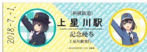
上星川駅「記念券」(イメージ)