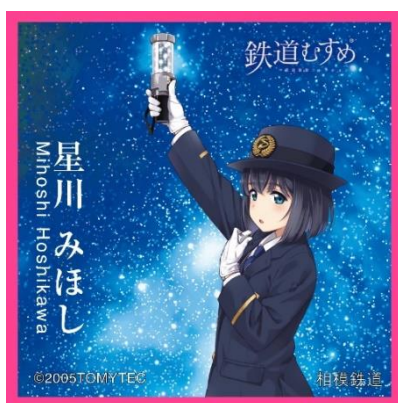
スマホクリーナー（イメージ）