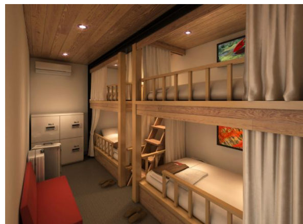
ご家族でも宿泊できる4ベッドルーム（イメージ）