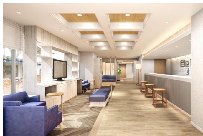
「相鉄フレッサイン 東京錦糸町」ロビー（イメージ）