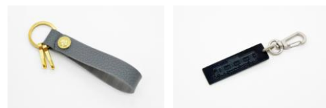
車両床材キーホルダー(左・イメージ)