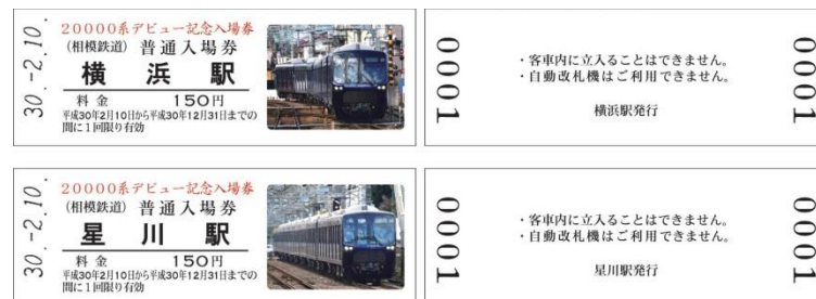
「D型硬券普通入場券」(イメージ)