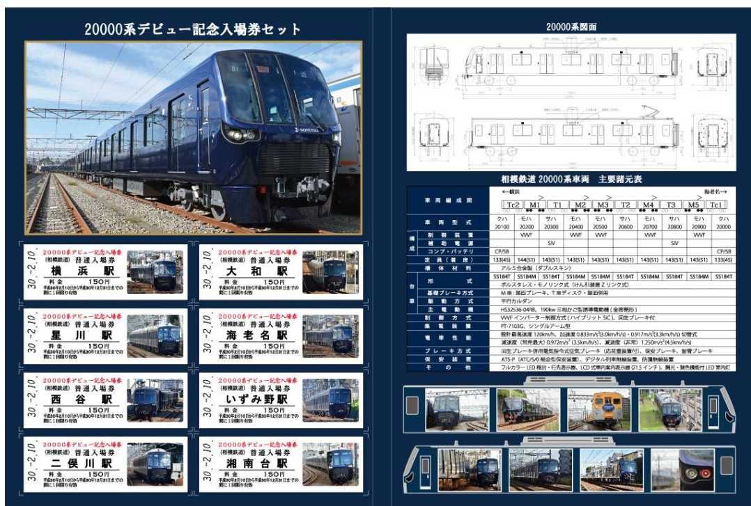
「20000系デビュー記念入場券セット」 (イメージ)