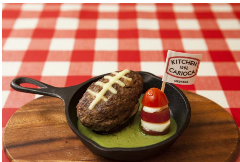
「横浜西口街バル2017」の様子（左）と「第3回 横浜西口街バル」の「キッチンカリオカ」提供メニュー（右）