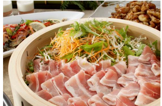
愛媛甘とろ豚のせいろ蒸し 白胡麻ソース