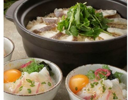
宇和島鯛めし（上）と松山鯛めし（下）