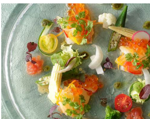
愛媛県産真鯛のマリネ 柚子風味エスカベージュ仕立て