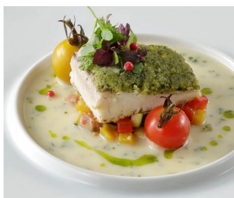
愛媛県産シマアジのバジル風味パン粉焼き ジュドコキヤージュ