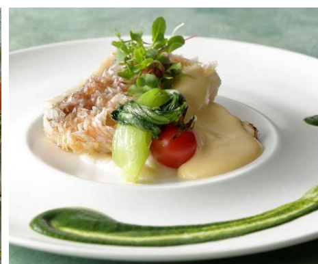
愛媛県産甘鯛の松笠焼き ハーブのピューレとサバイヨンソース