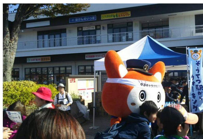
参加者を応援する「そうにゃん」（昨年）