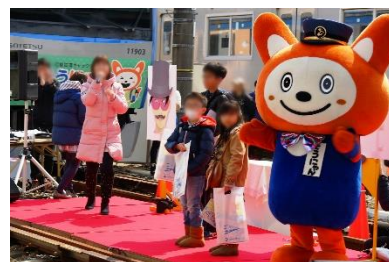
そうにゃんとふれあいイベント (イメージ)