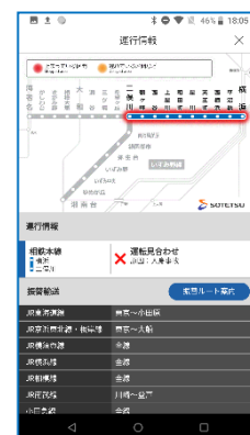
相鉄線・他社線 運行情報