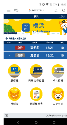
「そうにゃん」デザイン

キャラクターの「そうにゃん」や「20000系」車両をデザインした画面に変更できます。