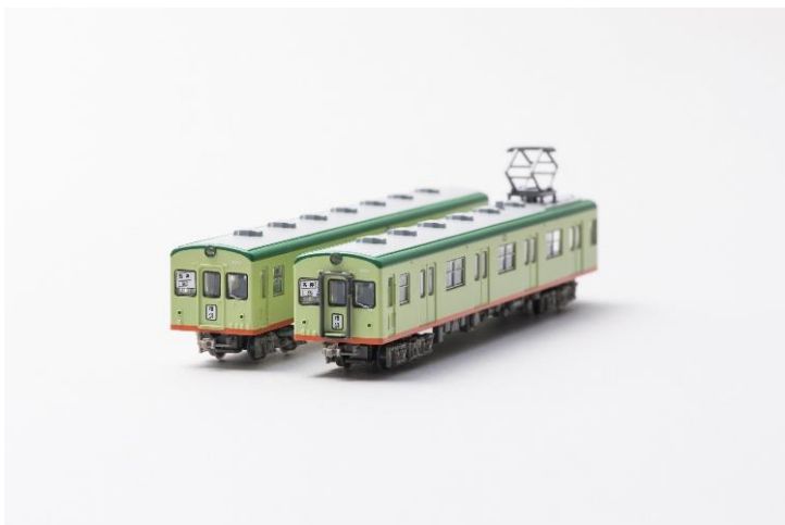
鉄道コレクション「3010系」（イメージ）