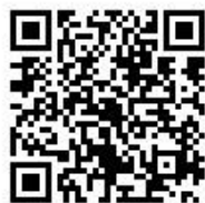
公式ウェブサイト

Twitter: https://twitter.com/yokohama_kurasu