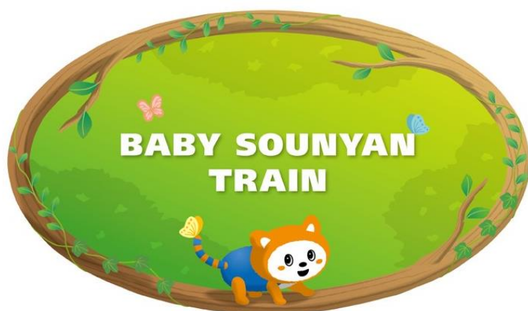
「六代目そうにゃんトレイン」の側面ラッピング（イメージ）