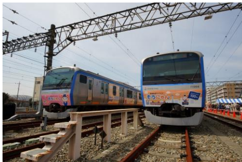
三代目（左）、四代目（右）