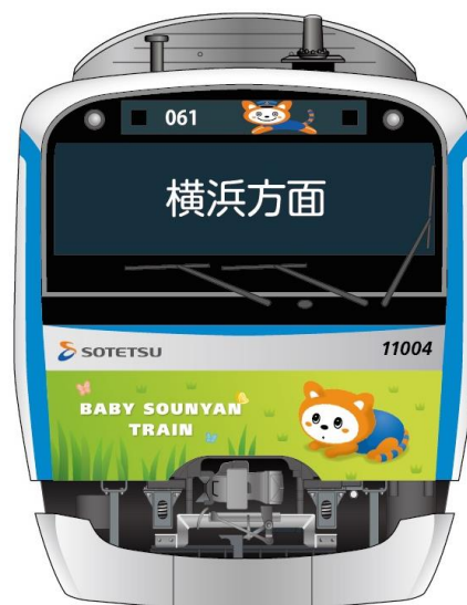
「六代目そうにゃんトレイン」横浜方面の前面（イメージ）